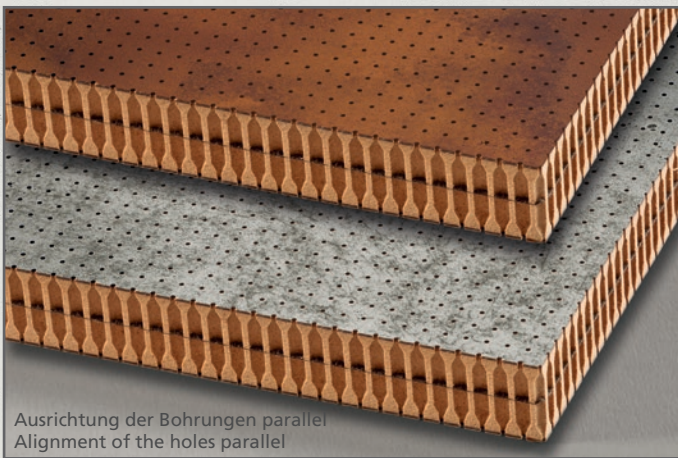
Ausrichtung der Bohrungen parallel Alignment of the holes parallel

• area marked red is the typical office sound