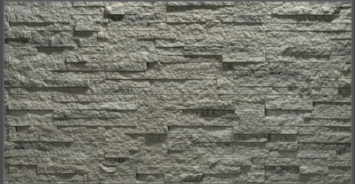
3500 breit geriegelt | wide rippled