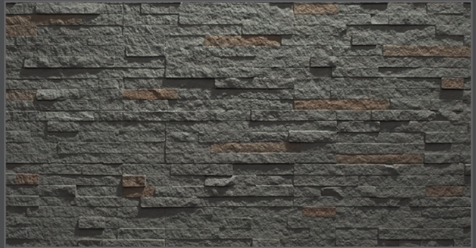
3200 breit geriegelt | wide rippled