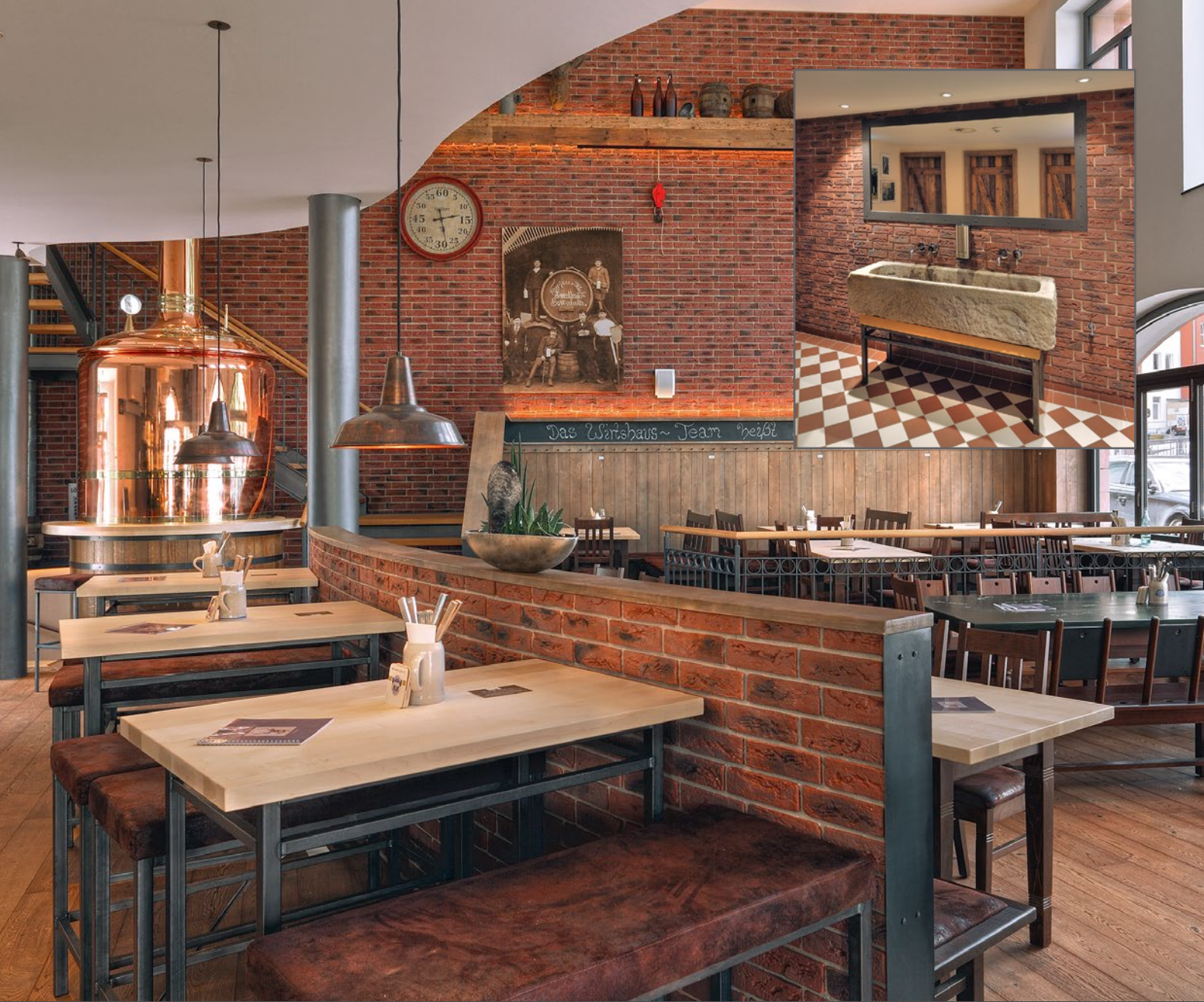
7100 V1 Backstein | Brick