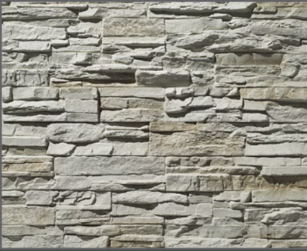
2000 Bruchstein | crushed stone