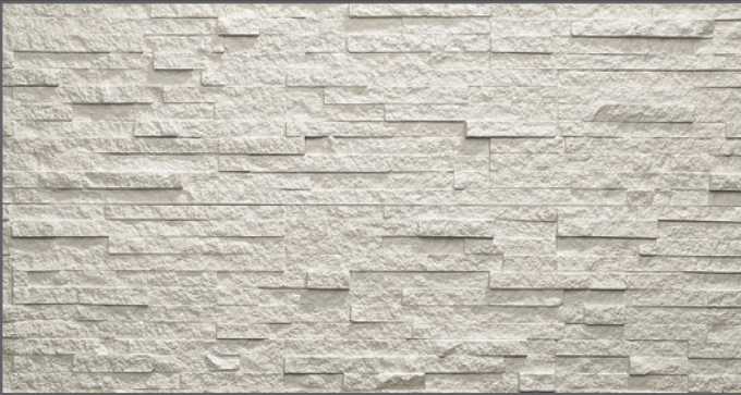
3100 breit geriegelt | wide rippled