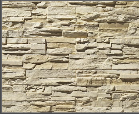
2300 Bruchstein | crushed stone