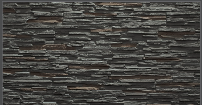
4200 schmal geriegelt | straight rippled