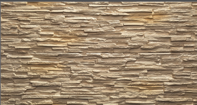
4300 schmal geriegelt | straight rippled