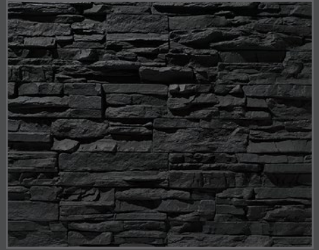
2400 Bruchstein | crushed stone