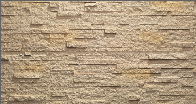
3300 breit geriegelt | wide rippled