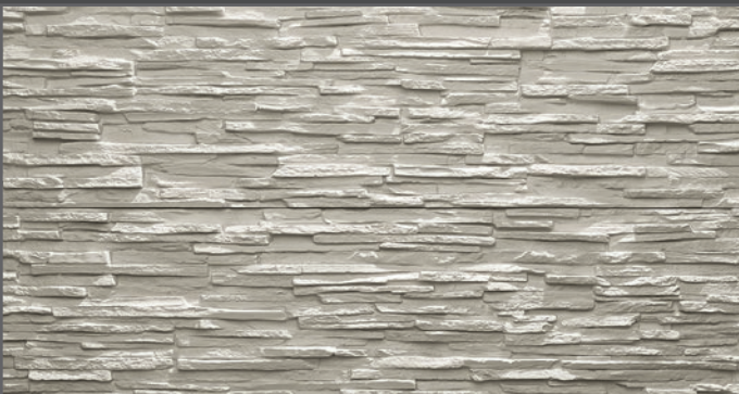
4100 schmal geriegelt | straight rippled